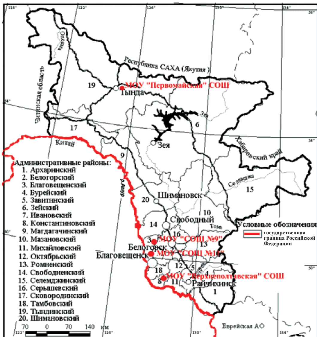
Рис. 1. Экспериментальные исследования в общеобразовательных школах Амурской области по выявлению ценностных ориентаций старших подростков

Методика М.П. Нечаева «Сферы интересов» изучает широту сфер интересов обучающихся, выраженности интересов к активным видам деятельности, общению, развлечению, творчеству. Эта методика направлена на выявление таких ценностных ориентаций как активная деятельная жизнь (полнота и эмоциональная насыщенность); наличие хороших и верных друзей; познание (возможность расширения своего кругозора, общей культуры, интеллектуальное развитие); продуктивная жизнь (максимально полное использование своих возможностей, сил и способностей); развитие (работа над собой, постоянное физическое и духовное совершенствование); творчество (возможность творческой деятельности); красота природы и искусства (переживание прекрасного в природе и в искусстве).