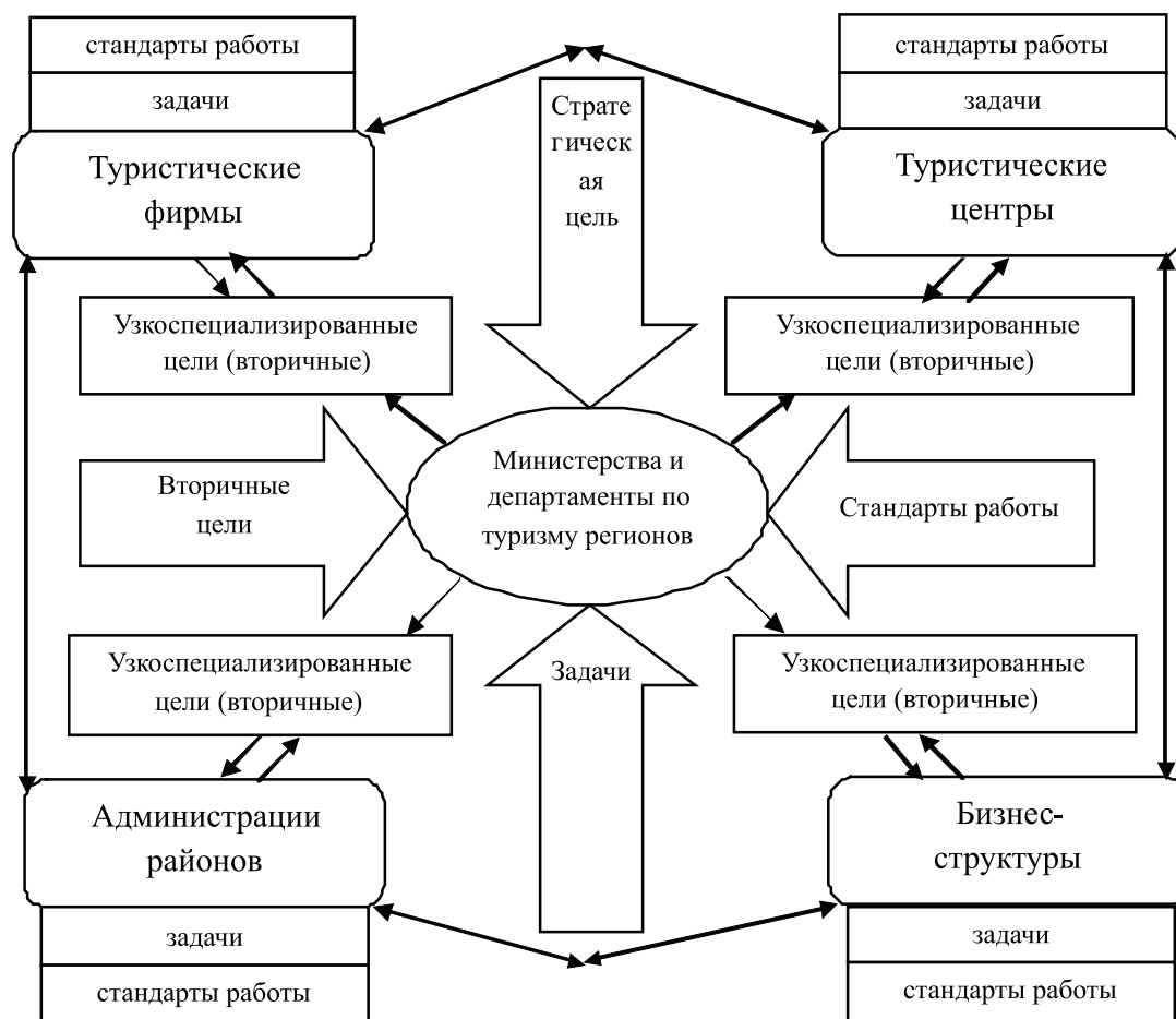
Рис. 2. Процесс согласования целей туристического сектора региона

Необходимо отметить, что министерства и ведомства также имеют свои вторичные цели, задачи и стандарты работы, которые способствуют достижению поставленной стратегической цели, но не пересекаются с целями, задачами и стандартами работы объектов процесса согласования целей.