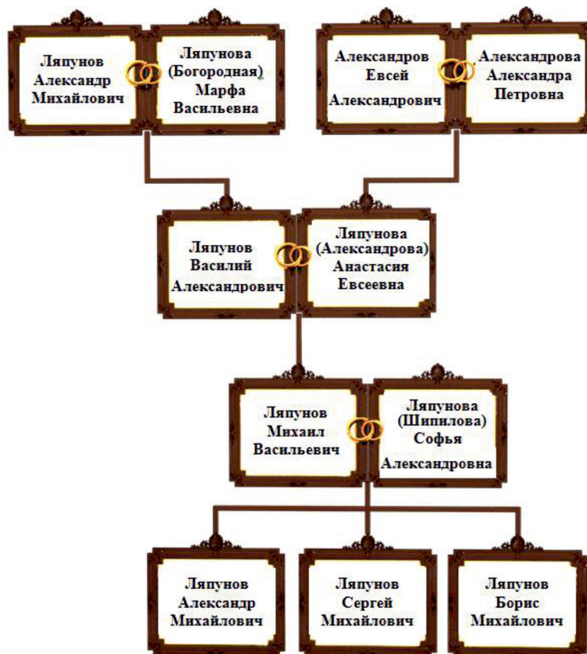
Рис. 3. Фрагмент родословного древа Ляпуновых