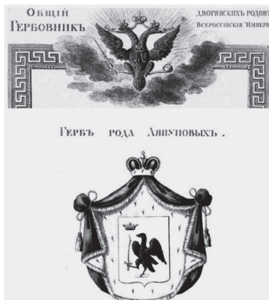
Рис. 1. Герб рода Ляпуновых

Наиболее полную родословную своего рода составил филолог Борис Михайлович Ляпунов, где ему удалось проследить цепочку от Рюрика. В ней он оставил открытыми некоторые вопросы, в основном связанные с утратой ряда документов в пожарах Пугачевского бунта [1, с. 8]. Эта родословная сохранилась у потомков знаменитого рода, но, к сожалению, не будучи опубликованной, пока не стала достоянием широкой общественности.