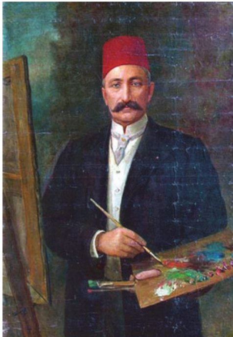
Рис. 1. Шекер Ахмет-паша, «Автопортрет», (год не ука.), холст, масло, 116 × 84 см. Музей Университета изобр. искусств им. Архитектора Синана, Стамбул