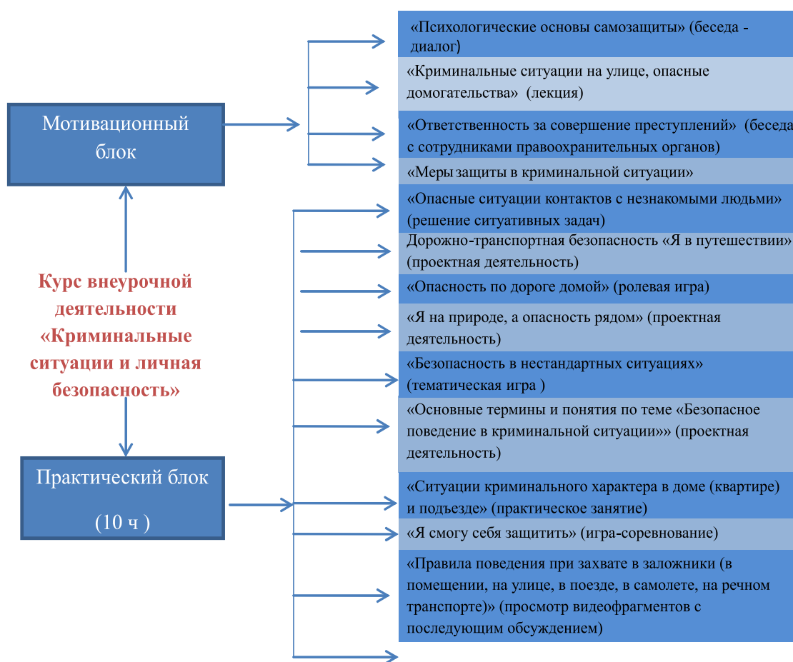
Рис. 2. Схема курса «Криминальные ситуации и личная безопасность»

Данный курс можно разделить на два блока: первый блок – мотивационно-информационный (5 ч) и второй блок – практический (10 ч) (рис. 2).