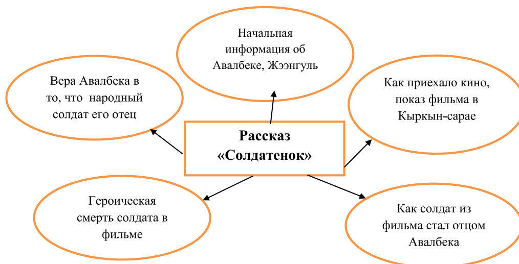
Рис. 2. Ключевые события рассказа [Позволяет доступнее знакомить с ключевыми событиями рассказа «Солдатенок» Ч. Айтматова]