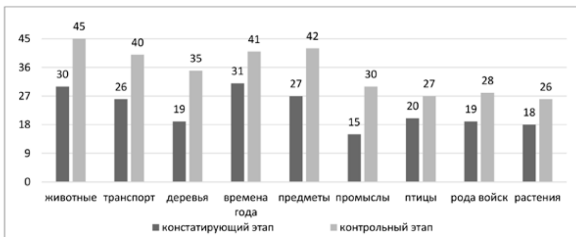
Рис. 1. Уровень развития представлений об окружающем мире у старших дошкольников на констатирующем и контрольном этапах (в баллах, тах 45)

Анализ рисунков показал, что дети стали больше внимания обращать на детали, стараясь в работе передать характерные особенности объектов окружающего мира. Например, дошкольники научились различать некоторые рода войск (пограничник, танкист, матрос), в рисунках появилось изображение форменной военной одежды, техники (танк, корабль). Сводные данные представлены на диаграмме (рис. 2).